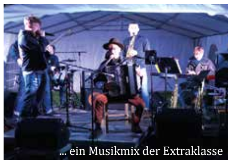
... ein Musikmix der Extraklasse