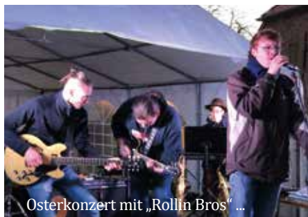
Osterkonzert mit „Rollin Bros“ ...